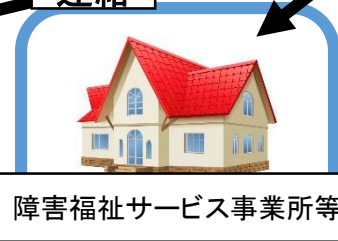
障害福祉サービス事業所等