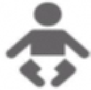
赤ちゃんの泣き声