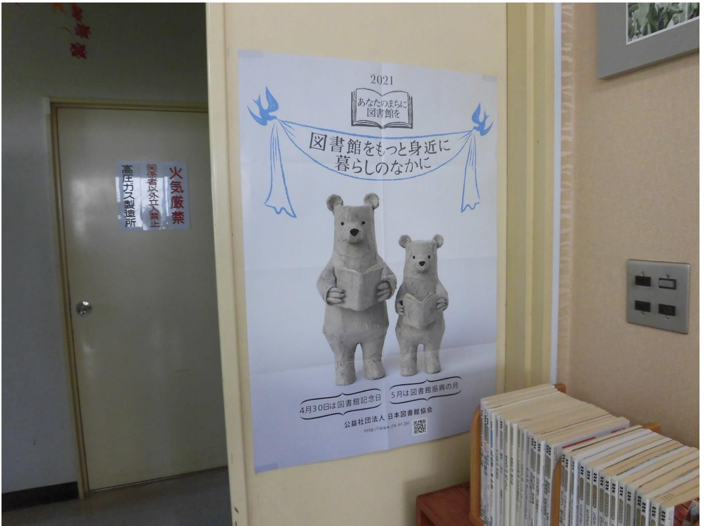
図書館をもっと身近に暮らしのなかに (図書館記念日、図書館振興月啓発ポスター) 日本図書館協会