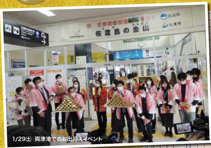
1/29(土) 両津港でのお出迎えイベント