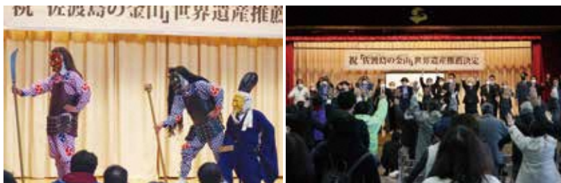
世界遺産推薦決定祝賀イベント

(一社)佐渡を世界遺産にする会主催で、「佐渡島の金山」の世界遺産推薦決定祝賀イベントが実施されました。提灯行列には、230名ものみなさまにご参加いただきました。