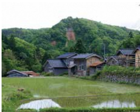
虎丸山(西三川砂金山)