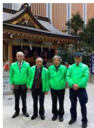
2022年2月17日 東京都中央区の福德神社にて「佐渡島の金山」国内推薦祈願成就お礼と世界文化遺産登録祈願を行いました。

潟県、佐渡市、首都圏の会それぞれが主催したイベント等は数えきれない程あり、思い起こすと走馬灯の如く瞬をよぎります。私達は行政への民間の単なる応援団体にすぎませんが、歯を食い縛り頑張り続けた県や市の関係者の喜びはいかばかりかと推察いたします。