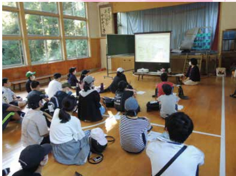
旧西三川小学校笹川分校を使った出前授業