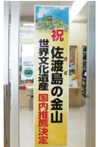
佐渡観光情報案内所