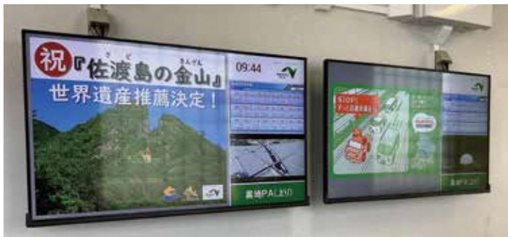
黒崎PAのデジタルサイネージ