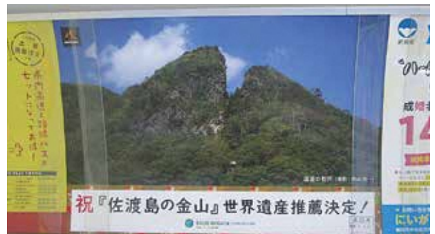
バス車内のポスター掲出