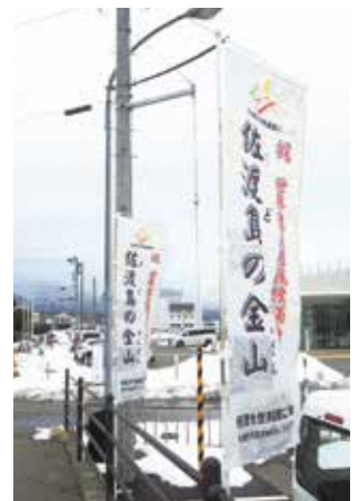
佐渡を世界遺産にする会ののぼり旗