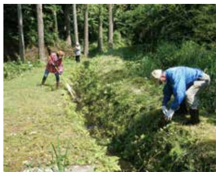
鶴子銀山跡での草刈りボランティア活動の様子