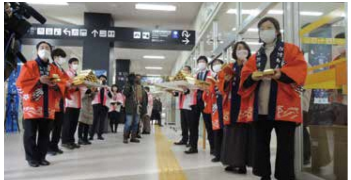
1月29日お出迎えイベント

そのほかにも、佐渡市内だけでなく、新潟市や新潟交通バス車内、NEXCO東日本新潟支社管内のサービスエリア・パーキングエリア、新潟空港でのポスター掲示などを行い、「佐渡島の金山」の推薦決定をお祝いいただきました。