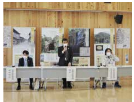
2021年推薦書提出記者会見