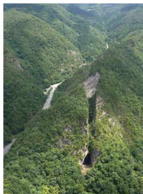
道遊の割戸 上空から手掘りによる大規模な露頭掘り跡