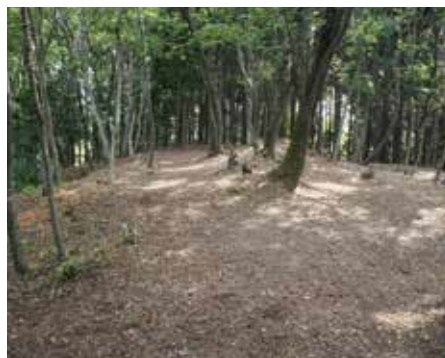
荒町遺跡(鶴子銀山)