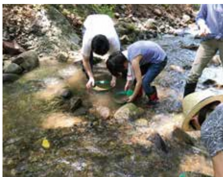
笹川集落での親子イベントの様子