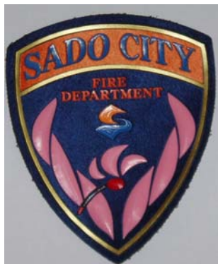
佐渡市消防本部エンブレム