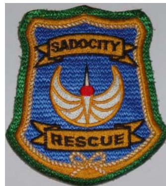
佐渡市救助隊エンブレム