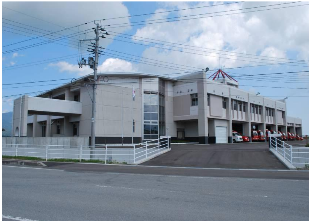
佐渡市消防本部・中央消防署・佐渡市防災センター