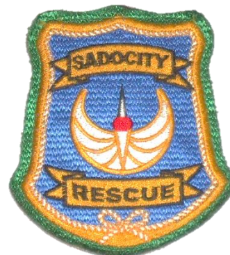
佐渡市救助隊エンブレム