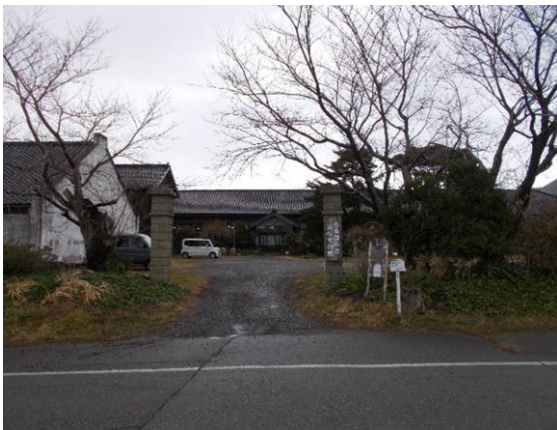
【佐渡国小木民俗博物館】