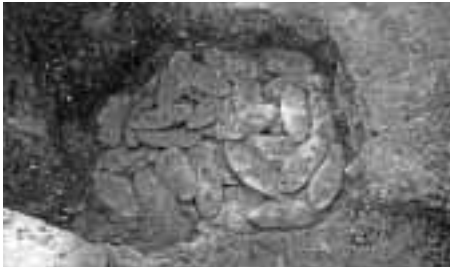
地中に埋められていた鉛板

平成6年(1994)、佐渡奉行所跡が国史跡に指定されると、奉行所を復元しようという動きが強まり、平成10年まで5か年をかけて発掘調査が実施されました。発掘調査では建物の礎石や、柱穴、石組、井戸、水路などのほかに、当時使用していたと思われる陶磁器類や金銀の精錬用具などが発見されました。中でも注目されるのが、御金蔵付近の地中に埋められていた172枚の鉛板です。