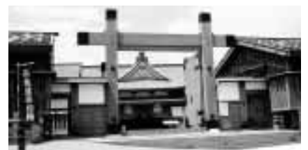
復元された佐渡奉行所大御門 材料のマツは秋田まで出向いて吟味した