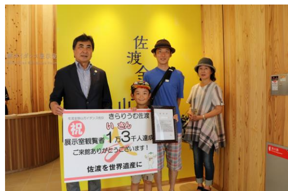
1万3千人目の観覧者 記念撮影