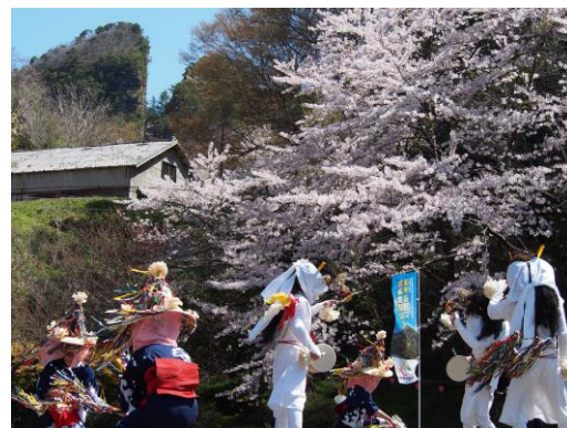
芸能公演（小獅子舞）