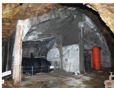
大立堅坑捲揚機室