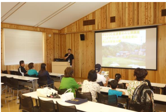
夏休み公開講座（西三川編）

期 日：令和元年8月10日（土）～12日（月・祝日） 会 場：きらりうむ佐渡 講堂 参加者：40名（西三川編16名、鶴子银山編11名、相川金銀山編13名）