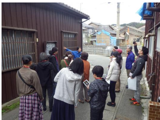
まち歩きツアー（下町散策コース）