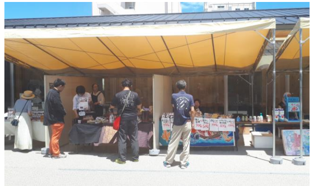
中庭を利用した露店の様子