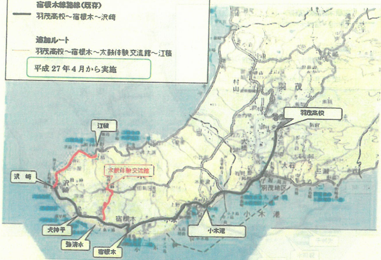
宿根木線①-2 (羽茂高校～琴浦・宿根木・深浦～江積)