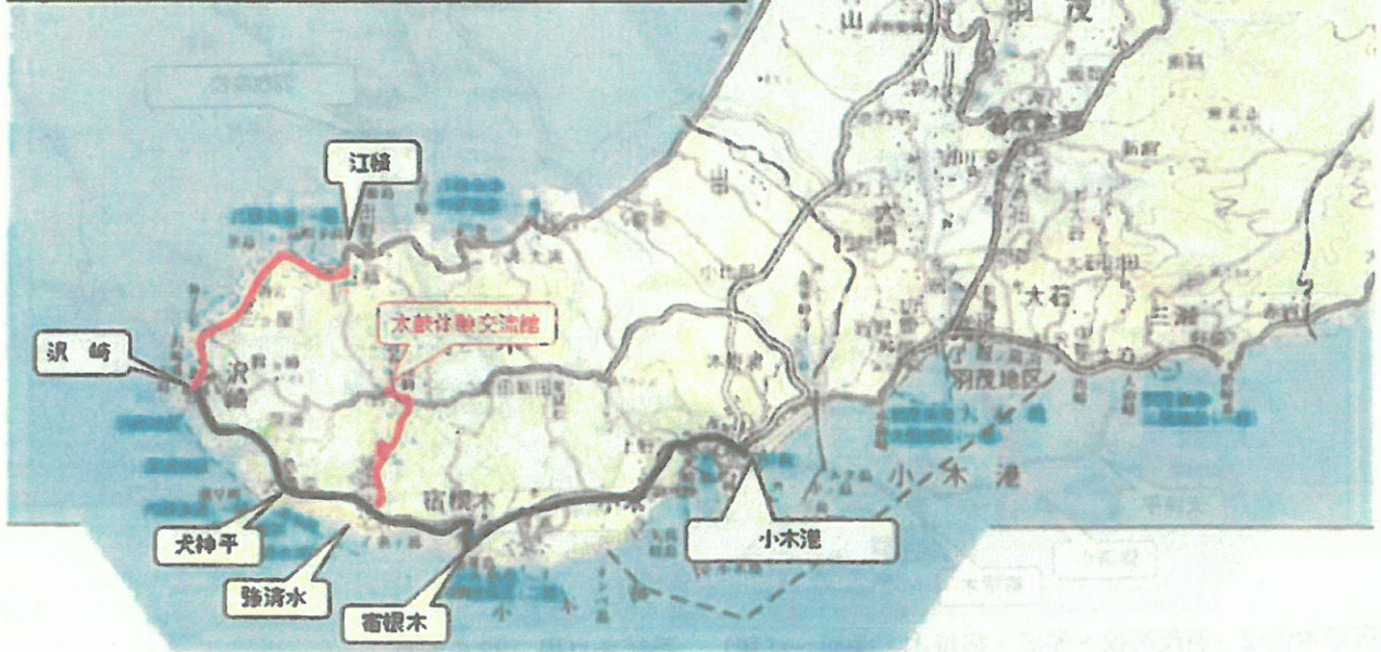
宿根木線②-2 (小木港～琴浦・宿根木・深浦～江積)