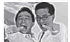
総合司会 デカメロン

〒952-0318 新潟県佐渡市真野新町488-8 佐渡観光協会中央支部内 よさこいおけさ実行委員会事務局 TEL.FAX 0259-55-3589