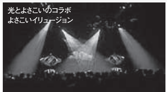
光とよさこいのコラボ よさこいイリュージョン