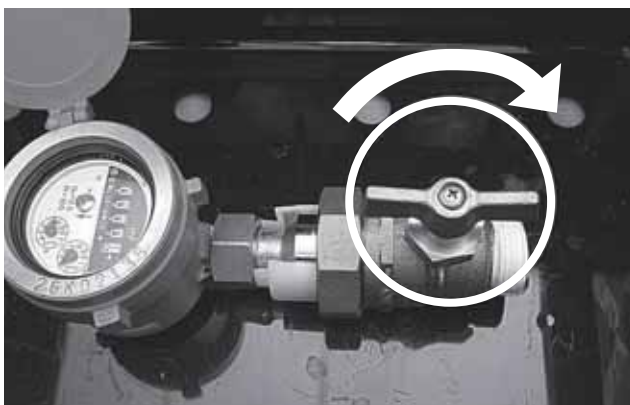
閉まるまで、90度回すタイプと、数回回すタイプがあります。