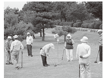
グラウンド・ゴルフ 一般ペアの部

また、グラウンド・ゴルフでは、大仙市が誇る日本でも有数の広大な公認グラウンド・ゴルフ場に親子ペア、職場ペア、一般ペアそれぞれ120組240名と初心者体験コース30名の計750名が参加。最年少は9歳、最年長は87歳とこちらも幅広い年齢層が参加しました。今回の大会は、競技の普及振興に重点を置き、低年齢層の方々に競技の楽しさを知ってもらうこととして開催され、地元の小中学生を中心に多くのグラウンド・ゴルファーが誕生しました。競技は、1つのボールを2人で交互に打つペアルールで行なわれ、お互いの1打に一喜一憂しながら、グラウンド・ゴルフの魅力を思いっきり堪能していました。大会の運営には多くの市民ボランティアの協力があり、大会をより盛り上げていました。