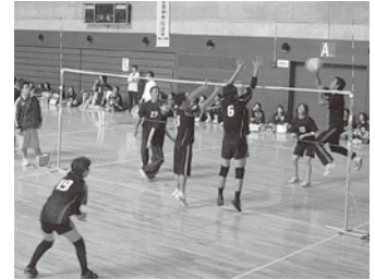
ソフトバレーボール ブロンズの部

9月2日(日)秋田県秋田市・大仙市にデモンストレーションとしてのスポーツ行事である「ソフトバレーボール」「グラウンド・ゴルフ」の大会を視察してきました。ソフトバレーボールは、1会場で15コートが取れる秋田市立体育館を会場に行われ、この競技の特徴でもある幅広い年齢層の競技者1,193人が集い、小学生から70歳代まで7部門15ブロックに分かれ、各コートとも熱戦が繰り広げられました。特に40歳以上のチームは、「うまい!」と観客をうならせるベテランのプレーが随所に見られました。和やかな雰囲気の中にも、熱気あふれる大会でした。