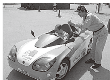
さて、電気自動車の乗り心地は?

湊地区のおんでこドームにおいて、エコフェスタ'07が開催されました。当日は、エコに関するテーマ展示や各種体験コーナーなど様々なイベントが催され、会場を訪れた人々にとってはエコの大切さについて考える良い機会になったようです。