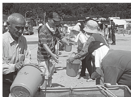
小学生も活躍 バケツリレー消火訓練

大杉、杉野浦、南新保、柳沢、真浦、赤泊、浦津地区を対象に震度6強の地震が発生したとの想定で防災訓練が開催されました。午前7時30分のサイレンを合図に、住民の高台への避難・誘導訓練、民生委員も参加しての一人暮らし高齢者の安否確認などが本番さながらに行われました。その後、赤泊港北埠頭を会場に、県の防災ヘリコプター「はくちょう」も参加しての救助訓練、アルファ米を使用した五目御飯の炊き出し訓練などが行われました。参加住民は積極的に訓練に参加し、骨折の見分け方や、効率的な消火器の使い方など消防署員に質問していました。災害はいつ起きるかわかりません。防災訓練などに参加し日頃から災害に対する備えをしておく心安心ですね。