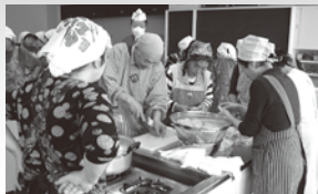
しまびと元気応援団「にしめの会」

老人保健事業／高齢者生活支援事業／障がい者福祉サービス／ファミリーサポートセンター運営事業