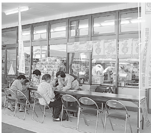
▲マイバッグ持参についてアンケート調査

今後も様々な活動を通し、消費者の視野を広げながら地域の活力に繋がっていきたく思います。