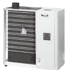
Woody (ウッディー) PS-1903