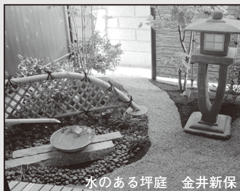
水のある坪庭 金井新保