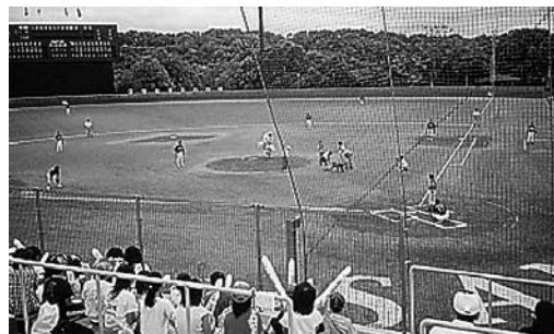
のじぎく兵庫国体軟式野球(成年)