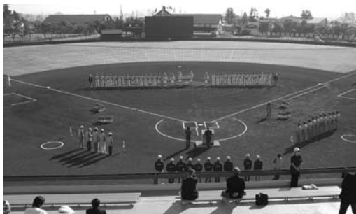
秋田わか杉国体軟式野球(一般A)

この勢いで、今年の「チャレンジ! おおいた国体」、来年の「トキめき新潟国体」でも大いに活躍してもらいたいものです。