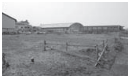
真野小学校 校舎改築 (現校舎裏の建設予定地)