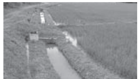
朱鷺と暮らす郷づくり認証制度 江などの設置により、生きものを育む