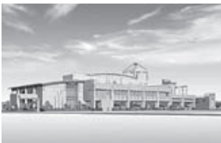
消防本部庁舎完成イメージ