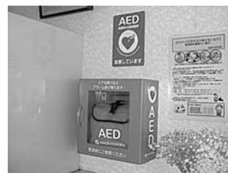
待鶴荘 入口に設置したAED

AEDは、心臓に電気ショックを与えて心拍を再開させる装置です。AEDの取り扱いについては、各消防署で講習会を実施していますので、この機会にぜひご参加ください。