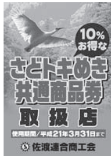
▲取扱店ステッカー

・発行団体 佐渡連合商工会（両津商工会） ☎27-5128 ・協賛 佐渡市（商工課） ☎63-3791