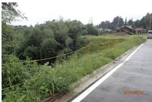
〈豪雨後の被害〉 (一般県道阿仏坊・竹田線)