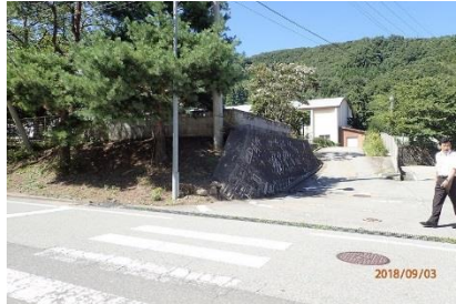
〈見通し具合の確認〉 (松ヶ崎小中学校、多田地内)