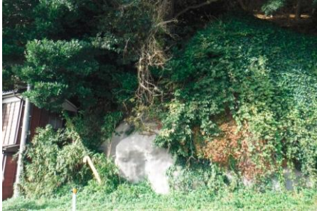
〈斜面の確認〉 (前浜小中学校、水津地内)