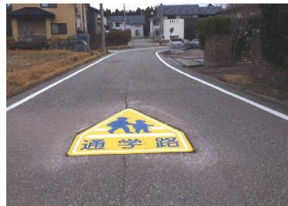
〈クイックシート（溶融タイプ）による補修後〉