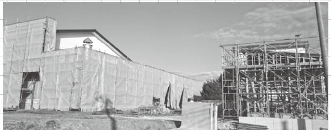
(建設中の両津学校給食センター)

両津学校給食センターの老朽化に伴う移転改築及び畑野学校給食センターを廃止するため、学校給食センター条例を改正することを認めました。