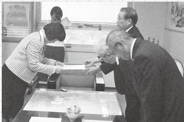
(9月17日 新潟県へ意見書、決議文を手交)

その後、佐渡汽船(株)は、10月1日から実施を予定していた貨物運賃20パーセント値上げについては見送ると正式に表明しました。