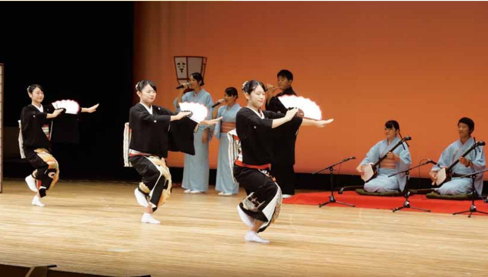
羽茂高校郷土芸能部 (9月6日、佐渡国際トライアスロン開会式)