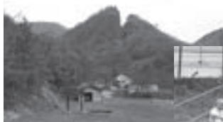
昨年7月の長岡市山古志闘牛場での炬火採火式ではマイギリ方式での採火が行われました