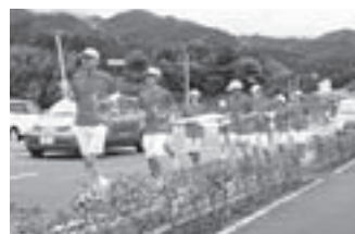
▲大会旗・炬火リレー(大分県臼杵市)

炬火リレーの走者は市内の小・中学生を中心に選定し、高校生、一般の方については募集を行います。炬火リレー・集火式およびリレー隊走者の募集についての詳細は、トキめき便り第7号(平成21年2月発行)の炬火イベント特集でお知らせします。