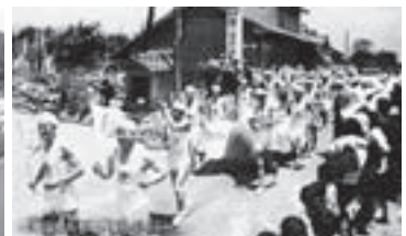
▲45年前の1巡目新潟国体でも島内の各地域をつなぐ大会旗のリレーが行われました