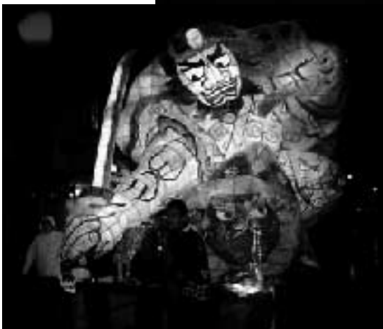
佐和田万燈まつり