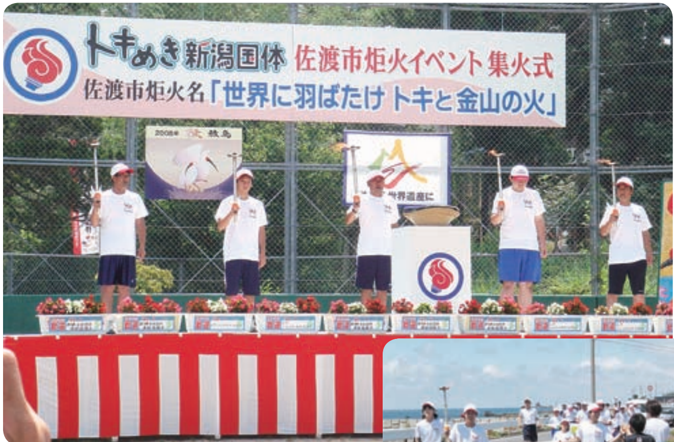
トキめき新潟国体炬火イベント

■発行：佐渡市議会 ■責任者：竹内道廣 ■編集：議会報編集特別委員会 〒952-1393 新潟県佐渡市河原田本町394番地 ☎(0259) 57-8133 ホームページアドレス http://www.city.sado.niigata.jp/