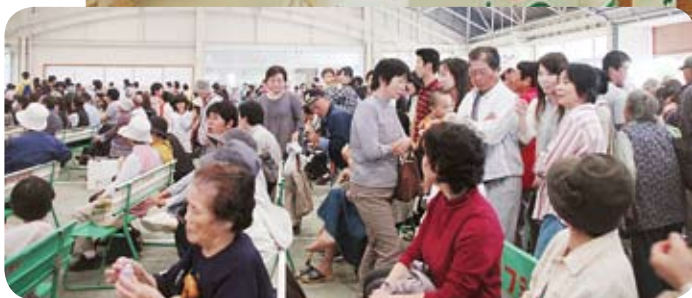
くだものまつり・真野活性化センター(いぶき21)