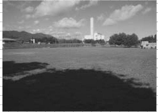
総合体育館の建設予定地(佐和地区つつじヶ丘公園)

スポーツ振興の拠点となる総合体育館の建設予定地が佐和地区つつじヶ丘公園内に決定し、その建設と周辺環境整備のための総合体育館基本設計経費の予算計上を認めました。