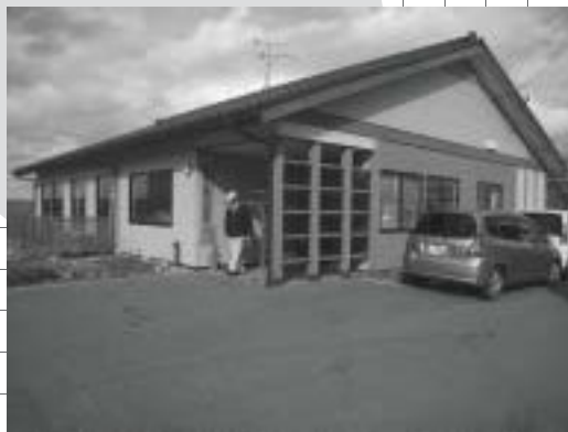
心身障がい者福祉センター