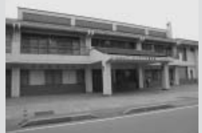
サンライズ城が浜・あかどまり城が浜温泉