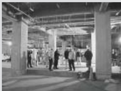
新佐渡総合病院建設現場(内部)

今秋に竣工予定の新佐渡総合病院建設工事を現地視察し、計画通り進んでいるとの説明を受けました。