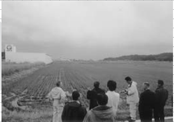
南部地区中学校用地購入予定地

南部地区中学校統合改築経費として、土地購入費・登記事務委託料・地質調査委託料・測量業務委託料等を認めました。