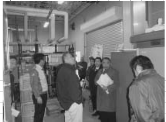
海洋深層水分水施設

心身障がい者福祉センター、ビューさわた、海洋深層水分水施設、サンライズ城が浜温泉等9施設についてそれぞれ選定した■体に管理を行わせることを認めました。