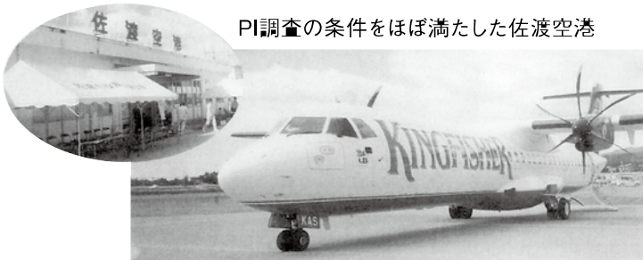
PI調査の条件をほぼ満たした佐渡空港

【質問】 合併特例債の期限は あと2年、市役所は建つの か。 【市長】 期限は違っているが、 市民の声、議会の声を聞き ながら慎重に対応したい。