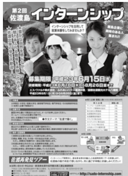
佐渡市インターシップラシ

【総合政策課】 平成31年度には今より100億■以上小さい予算、小さな政府になる中では、民間ベースで経済が■つていく仕組みが重要。そのためには離島の根幹の大事なものは、大型空港の整備、佐渡航路の低廉化と便利さが確立できる仕組みが必要である。責任を持つた新潟県がキツチリとやっっていくことを働きかけることが大事と考える。