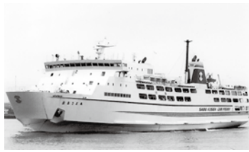
新造船と交代するおおさど丸

【質問】 新潟・両津航路新造船の基本設計作成業務委託についてプロポーザルによる業者選定の結果が佐渡汽船より公表された。その結果は同社株主である造船所1社のみの応募であり、しかも評価結果は700点満点中469点という極めて低い得点であった。21億円もの巨額な公金が佐渡市から支出される事業として本当に透明性に問題はないのか、また、この低得点に対し市長の見解は。