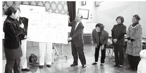
コンパクトシティ・モデル地区(羽茂本郷)での地域支え合いワークショップ

【高齢福祉課長】 高齢者の生きがい就労や雇用確保のための農業生産法人の設立、不動産担保型生活資金貸付け