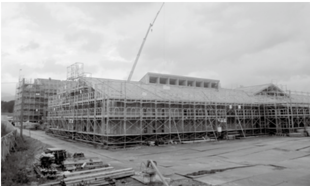
建設が進む金井小学校校舎