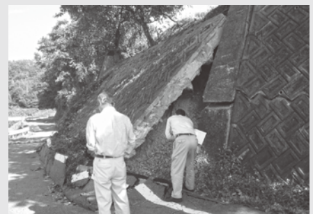
竹田(真野地区)の災害現場

平成25年7月～8月の豪雨災害について、真野・赤泊・羽茂地区の現地確認と被害状況を調査しました。