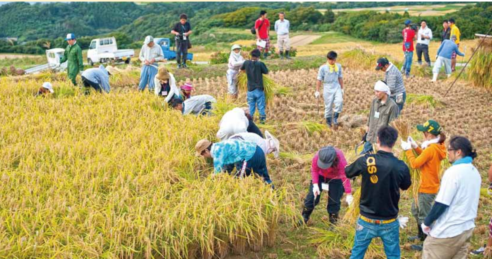
稲刈り体験 婚活イベント in 高千 (9月22日)