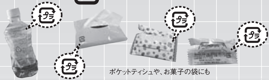
ポケットティッシュや、お菓子の袋にも