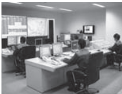
高機能消防指令センター