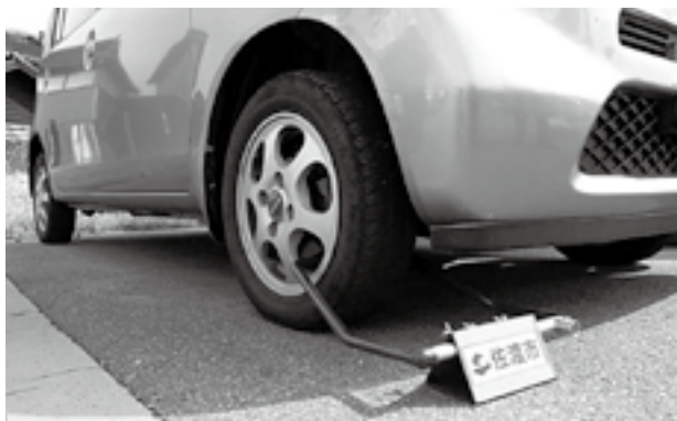
タイヤロックを装着された自動車

差押の新しい取組みとして、「自動車差押タイヤロック(車輪止め)」を導入します。所有する自動車などを差押え、タイヤロックを装着し運行不能状態とし、それでも納税されない場合は自動車などを引き揚げて公売することとなります。