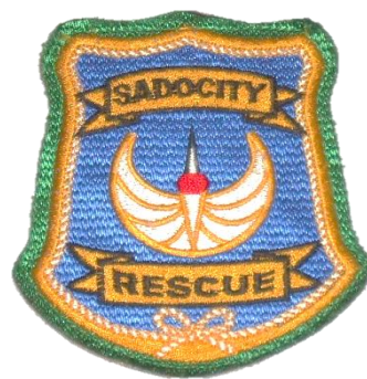
佐渡市救助隊エンブレム