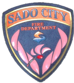
佐渡市消防本部エンブレム