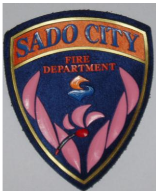
佐渡市消防本部エンブレム