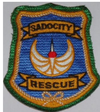
佐渡市救助隊エンブレム