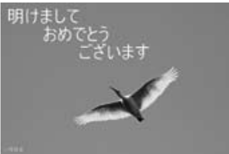
トキの年賀状を、送ってみませんか!