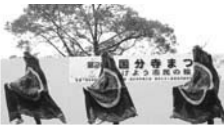
「杉野浦獅子舞保存会」による舞台公演

佐渡物産展では、毎年恒例となつている活魚コーナーに長蛇の列ができ、佐渡から運ばれた活きのよいヒラメ、タコ、サザエ、アワビなどが飛ぶように売られていました。ここでは、毎年8月に遠泳交流のため佐渡を訪れている「国分寺市水泳協会」約20名が、交流の一環として物産販売に協力してくださいました。また、芸能では「杉野浦獅子舞保存会」が国分寺市より招請され、佐渡に古くから伝わる小獅子舞を披露しました。会場には、国分寺市民だけでなく、郷土の芸能を見に訪れた