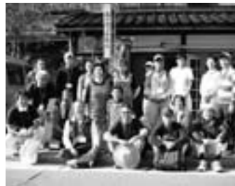
ゴール地点での集合写真

幸運にも秋晴れとなり、15名の参加者を得て実施。普段は車で通ってしまう外海府の道を歩いて、景観ウォッチングをしました。ご参加いただいた皆さんおつかれさまでした。