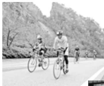
道遊の割戸を背景に、急な坂道を上る選手たち

佐渡金山をスタートして、大佐渡スカイラインの最高峰(標高942m)までの全延長13km、高低差840mに挑む第1回佐渡ヒルクライム大会が開催されました。佐渡ロングライド・佐渡トライアスロン大会とならび、自転車を活用したこのイベントに県内外から129名が参加し、あいにくの悪天候の中、選手たちはゴールを目指し、息を荒くしながら力強くペダルを踏み込んでいました。参加した選手からは「スタッフのサポートがすばらしく、レース後の食事もとてもおいしかった」