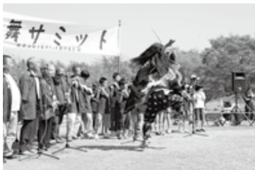
伝統芸能を活かした地域づくり (佐渡小獅子舞サミット)

※募集期間中は、書類の書き方や補助制度に関する相談を受け付けていますので、担当係までお問い合わせください。