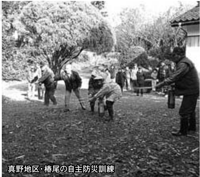
真野地区・椿尾の自主防災訓練