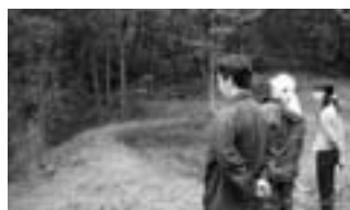
整備されたピオトープや間伐の様子などを見学

佐渡國しま海道の重点エリアである小佐渡東部エリアのトキ街道・山道の見学会を行いました。トキの2次放鳥も行われ、注目されているのが小佐渡東部です。旧トキ保護センターがあった清水平のピオトープなどを見学、参加者は手入れの行き届いた里山ハイキングを楽しみました。