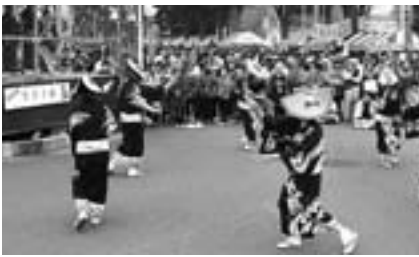
「なぎさ会」による「けやき通り」での公演

佐渡全島に部員を有する「佐渡商工会青年部協議会」が中心となつて「入間万燈まつり佐渡物産展実行委員会」を組織し、総勢約40名が物産展に参加しました。毎年人気を博している「おけさ柿」の販売コーナーには、物産展開始時間前に約1200人もの行列ができたほか、祭り2日目の物産展終了時間前には持ち込んだすべての品が完