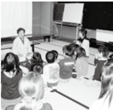
佐渡の民話「おちあいばしムジナ」に聞き入る参加者

今年も10月28日から毎週水曜日の午後6時30分から8時まで、全6回の日程で親子読書活動を行いました。