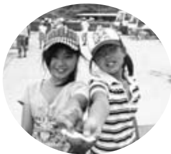
国分寺市とのジュニアサマー 野外活動交流会