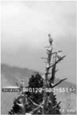
携帯電話の待受画面にどうぞ!

②大きな画像の上で右クリックし、「名前を付けて画像を保存」を選びダウンロードします。(Windowsの場合)ダウンロード先は、使用されるパソコン、個人の設定により異なります。 お問い合わせ トキ交流会館 ☎24-6040