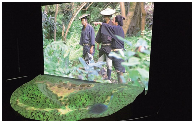
シアター1 西三川砂金山 大流し