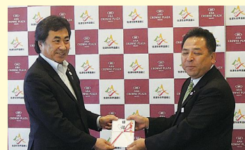
ANAクラウンプラザホテル新潟 様

皆様からのご芳志は、資産の保存整備のために活用させていただきます。今後とも引き続き、ご支援のほどよろしくお願いたします。