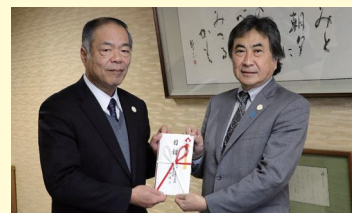
佐渡汽船運輸株式会社 様

皆様からのご芳志は、資産の保存整備のために活用させていただきます。今後とも引き続き、ご支援のほどよろしくお願いたします。