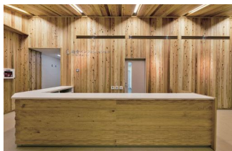
総合インフォメーション