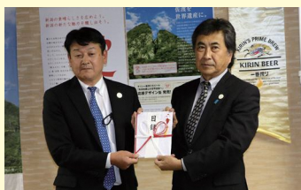
キリンビール株式会社新潟支社 様

ANAクラウンプラザホテル新潟 様 キリンビール株式会社新潟支社 様 佐渡汽船運輸株式会社 様 オートバンク佐渡支店 様 ㈱伊藤園 様 佐渡民謡舞踊連盟 様 他