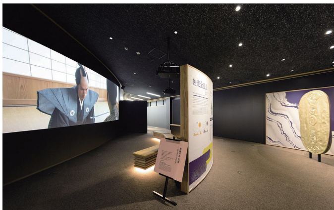
ウェルカムシアター 豊穰の島 佐渡