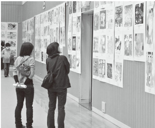
昨年の佐渡市美術展覧会