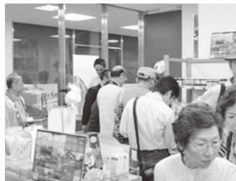
お客で賑わう店内