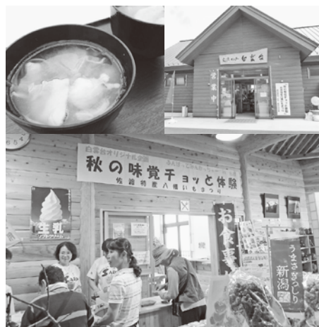
「ふんばれっちゃ!佐渡2010・秋の佐渡げんき キャンペーンin白雲台」(9月18日~23日)。 地場産の食材を使った豚汁の無料試食を行いま

います。 そのほか、名古屋市で開催される生 物多様性条約第10回締約国会議(CO P10)や、アルビレックス新潟の ホームゲームでの宣伝活動な ど、島内外でのイベントで佐渡 観光をPRしていきます。また、 姉妹都市(入間市・国分寺市)や、 新潟県、新潟市、長岡市、上越市 などの県内自治体と連携した誘 客活動やメディア等での佐渡PR にも、積極的に取り組んでい きます。