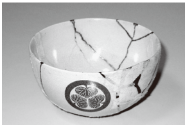
家康から拝領されたと伝わる茶碗

味方家は、江戸時代の佐渡金銀山における山師の中心的存在として、間歩(坑道)の開削や水抜き技術の導入などに率先して取り組み、鉢山の繁栄に大きく貢献しました。初代の味方但馬(1562〜1623)は、佐渡以外に摂津(現大阪府・兵庫県)の多田銀山や伊勢(現三重県)の銀山の経営にも関わり、京都・江戸に屋敷を所有するほどの財力を有し、根本寺など島内各地の寺院にも多額の寄進をしたことで知られています。