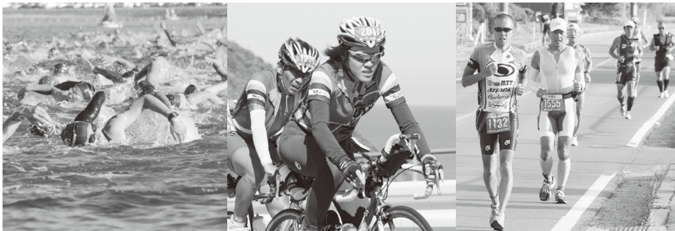
鉄人たちの熱い戦い