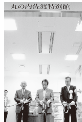
オープニングセレモニー(左から摩尼首都圏佐渡連合会会長、甲斐副市長、末武社長)