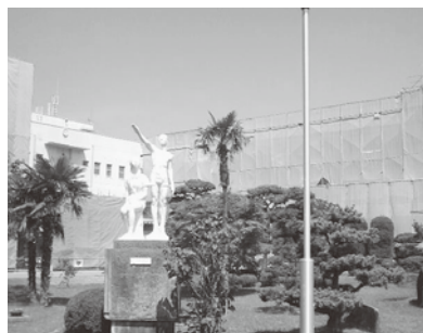
耐震工事中の校舎

さて、当校は、キャリア教育を中核に据えた教育活動を展開しています。自分の将来の夢や生きる目標を定め、望ましい勤労観、職業観をはぐくむことを目指した「生き方指導」を進めています。7月には、佐渡島内外から各職種のプロの方々をお迎えし、生徒