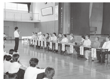
キャリアセミナーの全体会

自らが将来を考える「キャリアセミナー」を開催しました。当日は、講師の方々の仕事に対する熱意を込めたお話や実演・実習を通して、夢を抱き、自分の生き方を考え、現在大切なことについて考える生徒の姿が見られました。