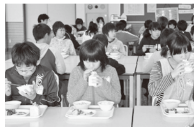
統一献立の給食(金泉小学校)

11月24日～26日に市内小中学校や養護学校で、佐渡産の食材を使った統一献立の給食が実施されました。