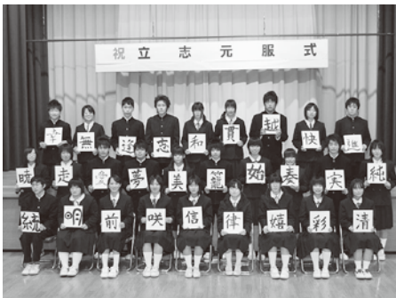
志を文字に・立志元服式

毎年新年を迎えると、立志元服式を行っています。この式は義務教育を終えようとしている中学3年生を対象に、自分の将来の進路について考え、保護者と話し合う機会をつくることを目的としてい