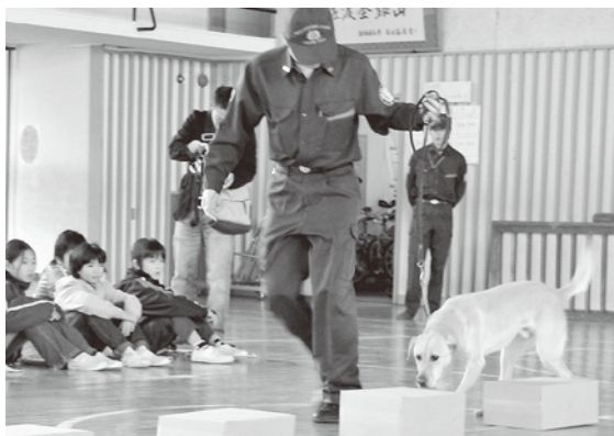
麻薬探知犬による実演

また、東中学校では新潟税関支署と佐渡東警察署との合同による「非行防止教室」も行われました。