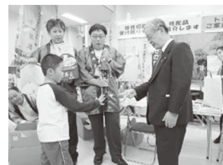
佐渡島民とのじゃんけん大会