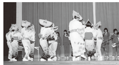
総合学習の成果発表会

ます。式では講師をお迎えして講話を聞いた。生徒が将来の夢について発表したりします。さらに、一人ひとりが自分の目標を漢字一文字で色紙に書き表し、将来に向けての決意を新たにします。この時の3年生のりりしく晴れやかな表情は、頼もしささえ感じさせてくれます。