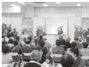
ステージイベント「佐渡民謡」

佐渡島ブースでは、“豊かな自然！歴史・文化かおる島『佐渡』”をキャッチフレーズに、トッキッキを先頭にして、特徴ある農畜産物、海産物の販売をはじめ、地酒の試飲、佐渡観光の紹介が行われた。『佐渡市トキ環境整備基金』に募金をしていただいた方を対象に、朱鷺と暮らす郷づくり認証米をアピールしながらゲームを行い、毎回大変多くの方々が参加された。ゲームの一つとして“佐渡島民とのじゃんけん大会”が行われ、来場者の相方として高野宏一郎市長も飛び入り参加され、会場を大いに盛り上げた。アイランダーステージでは、おけさアートの会ならびに若波会による相川音頭や佐渡おけさなどの披露が行われた。また今回は、大野青年会による“鬼太鼓”の演舞が行われ、勇壮な躍動感に会場いっぱいの来場者が酔いしれた。来場者アンケートによる“もっともよい印象だった島”として主催者発表が行われ、“佐渡島”が“第1位”に選ばれる栄誉に輝いた。（文責：佐渡市東京事務所 榎谷端夫）