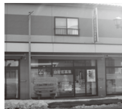
事務所の外観 (青い看板が目印)