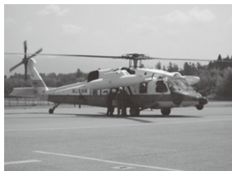
海自救難ヘリコプター(佐渡空港)