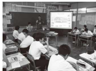
中学校での職業紹介