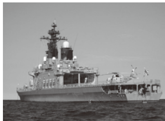
護衛艦しらね(両津湾)