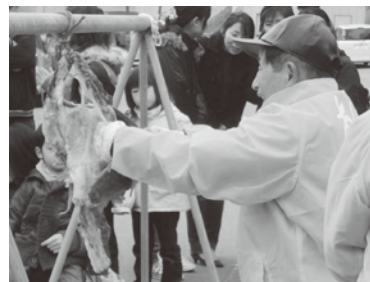
あんこうの解体ショー

2月27日、片野尾地区(両津)の新イベント「片野尾あんこうまつり」が開催されました。訪れた人たちは、あんこう汁やあんこう丼を堪能していました。また、地場産の海産物の販売などに長蛇の列ができるなど、賑わいをみせていました。芸能ステージでは、片野尾歌舞伎の名場面や、地元住民のダンスなどが披露され、会場は大いに盛り上がりしました。