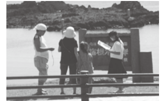
ガイド活動中の生徒

を行います。地元の宿根木を愛する会の方々と連携をして学習会を進めていきます。そして、夏休みの土日とアースセレブレーションの日に活動を行います（昨年度は10日間行い、1368名の観光客をガイドしました）。