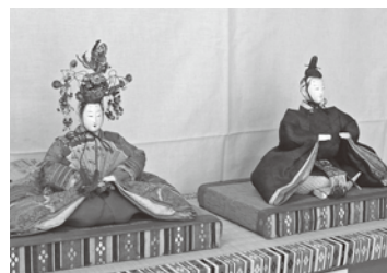
江戸時代末期のおひなさま

3月1日~21日に「佐渡國相川ひなまつり」と「佐渡両津のおひなさまお宝めぐり」が開催され、民家や商店に飾られたひな人形で町は華やぎました。関連イベントとして、「相川のお寺めぐり涅槃図展」も行われ、相川地区の寺院が所蔵する貴重な涅槃図が公開されました。