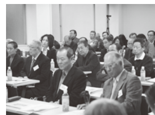
聴衆で埋まる会場