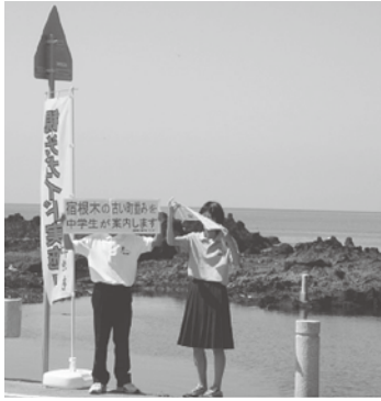
呼び込みをする生徒

この活動の目的は、「ふるさとを愛する心の育成」が大きな柱となっています。具体的な活動としては、毎年6月にガイドするため、部員を募集します。昨年度は、全校生徒の半数以上が応募しました。7月に事前学習会と現地学習会