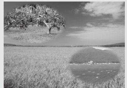
島とは思えない広い国中平野と加茂湖、名産品の柿