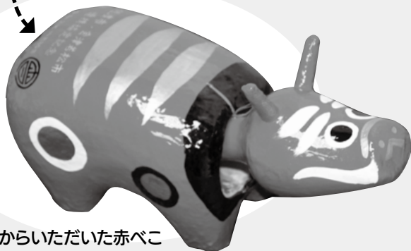
会津若松市からいただいた赤べこ