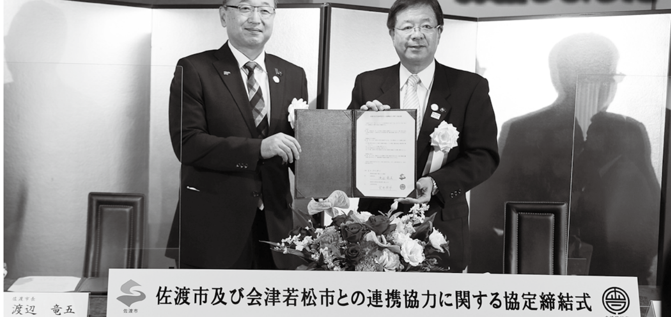
佐渡市及び会津若松市との連携協力に関する協定締結式