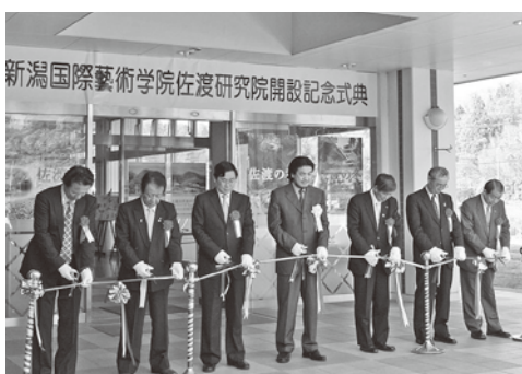
開院宣言のあとに行われたテープカット

作品ギャラリーなどを開設。「佐渡は世界のアトリエ・国際教育研修基地」として、国内外から学生を迎え入れることで、芸術文化を通じた佐渡への誘客が図られ、佐渡の商業・農業・観光振興など地域の活性化が期待されます。