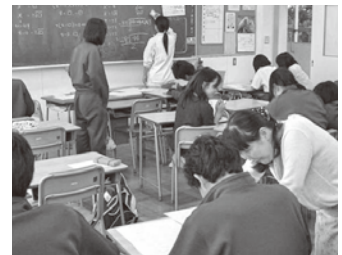
学習支援ボランティアによる数学の補充学習

は3つのボランティアで合わせて16名の保護者や地域の皆様に応援していただいています。大変ありがたく思っております。