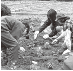
中庭整備ボランティアによる花苗の植え付け

当校では教育課題の一つとして「保護者・地域からの協力体制の確立」を掲げ、保護者や地域の皆様から学校の教育活動に積極的に参画していただくことにより、信頼される学校を目指しています。一例をあげれば、 学校支援ボランティア の活動です。「学校だより配布ボランティア」は学校だよりを地域に配布するために、市役所にある地域ごとのポストに仕分けをしていただいています。「学習支援ボランティア」は放課後に行われている数学の補充学習で生徒の指導を支援していただいています。生徒には好評です。「中庭整備ボランティア」は生徒と一緒に中庭での花苗の植え付けをしていただいています。今年度