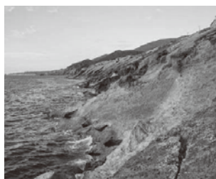
図2. 傾いた地層が続く平根崎