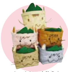
にゃんじー小物入れ